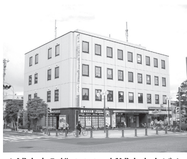
▲浦安市入船4-1-1 新浦安中央ビル